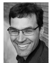
Florentin Abächerli Florentini gmbh