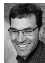
Florentin Abächerli Florentini gmbh

«INSPIRIERBAR versteht es, die Kursteilnehmenden wahrzunehmen, auf sie einzugehen und sie in ihrer Entwicklung zu unterstützen.» (Teilnehmerin 2018)