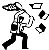
Stärkung der Kompetenzen