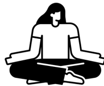
Reflexionsraum und Klarheit