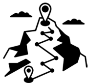
Weg in stürmischen Zeiten

Wir befassen uns mit: Identität & Sinn, Vertrauen & Verbundenheit, Begegnung & Gesprächsführung und mit Problemlösung & Entscheidungskraft